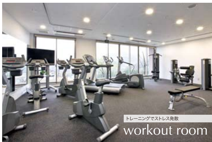
トレーニングでストレス発散 workout room