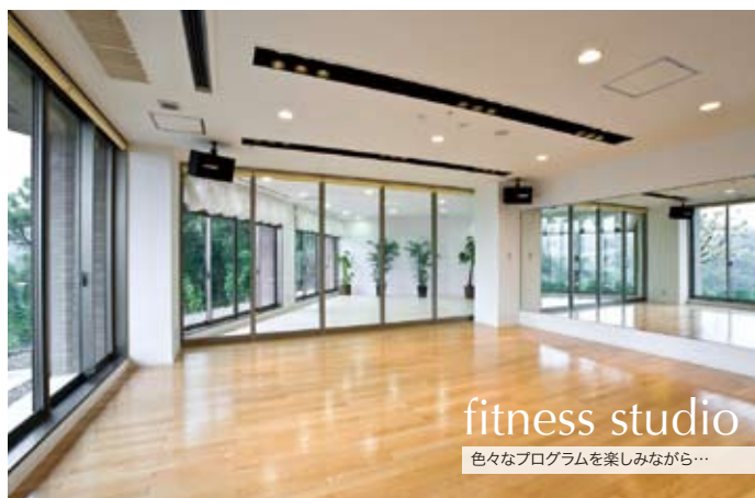
fitness studio 色々なプログラムを楽しみながら…