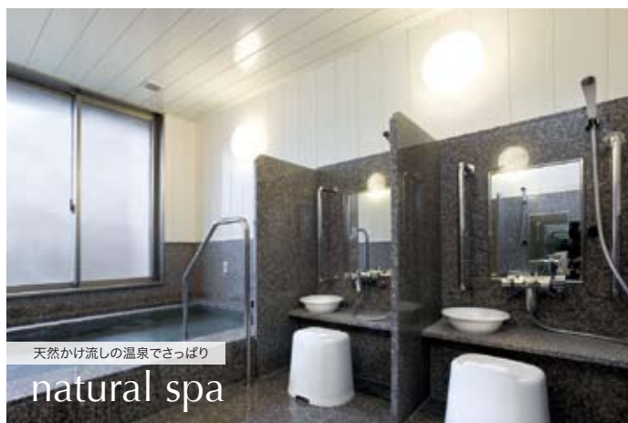
天然かけ流しの温泉でさっぱり natural spa