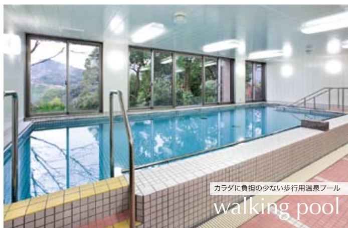
カラダに負担の少ない歩行用温泉プール walking pool