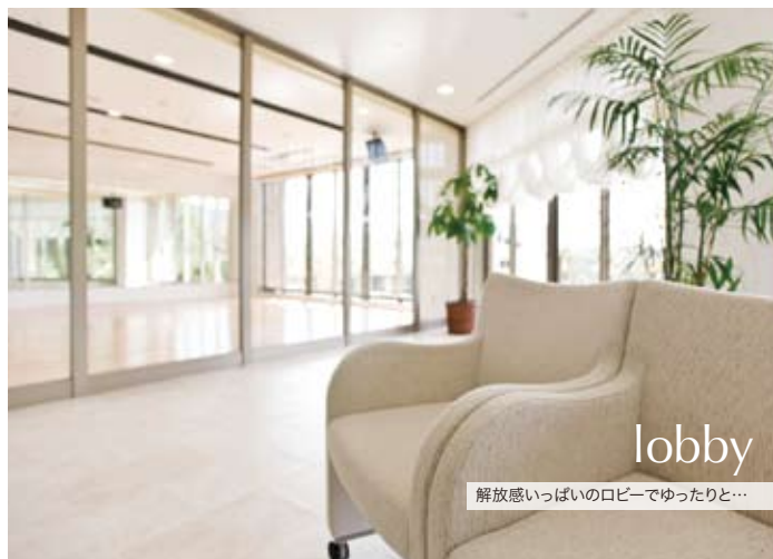
lobby 解放感いっぱいのロビーでゆったりと…