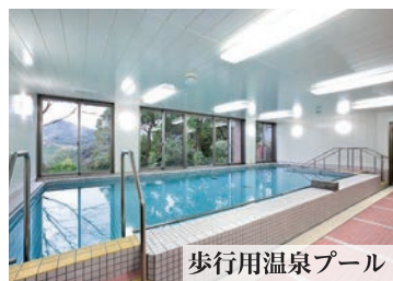
歩行用温泉プール