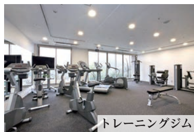
トレーニングジム