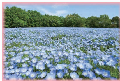
施設の目の前に広がるネモフィラ畑