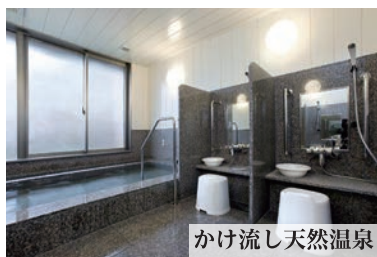
かけ流し天然温泉